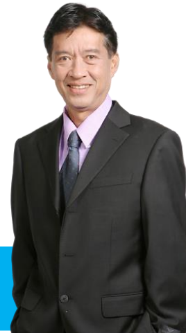
(ผู้จัดการ)